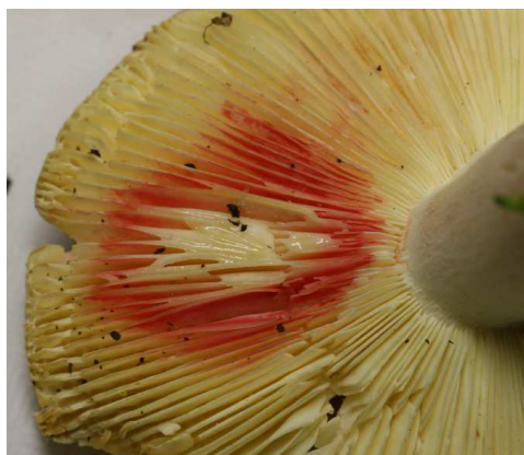
Réaction en rouge sur Russula sardonia (= R. drimeia)

L'ammoniaque concentrée a le pouvoir de ramollir les hyphes de champignons frais et de regonfler les exsiccata. C'est, de plus, le solvant de colorants tels que le rouge Congo ou le vert d'anthracène.